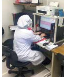
後姿で失礼します

A. 主な仕事内容は、入院患者様や通所サービスの利用者様に提供する献立の作成や食材の管理、栄養管理、入院や外来の患者様への栄養指導等になります。